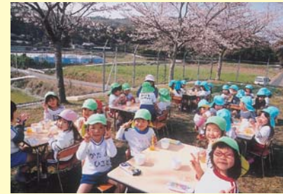
桜の木の下で 今から昼食だよ

文旦保育園は、シュタイナー保育理論のもと、大切なお子様をお花畑や、野菜作りなど自然を手でふれながら保育し頑張っております。「子育てに熱意のある方」「かしこく育てたい方」「子育てに不安がある方」は、お気軽に文旦保育園をのぞいてみて下さい。保育士が心をこめて対応、アドバイス致します。