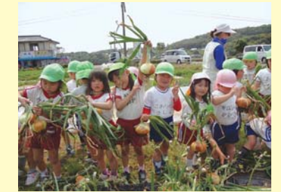
玉ねぎ収穫 こんなに大きいのがとれたよ

平成24年3月、文旦保育園では、35名もの卒園児を立派に送り出すことが出来ました。4月から新しく入園した児たちは、元気にのびのびと園生活を楽しんでいます。入園数に若干余裕がありますので下記の通り募集します。