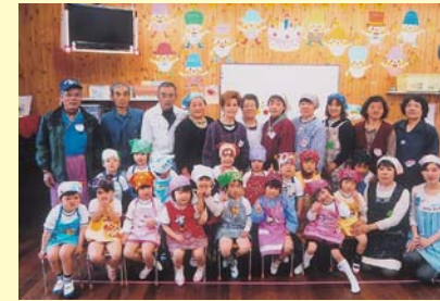
世代間交流 春のもちつき